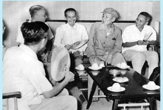
Trích trong Bác Hồ với chiến sĩ, Nxb. Quân đội nhân dân, Hà Nội, 1998, t.3.

Và có lẽ vì thế mà khi cơ quan định lắp máy điều hoà nhiệt độ nơi Bác ở, Bác bảo đem ra cho các đồng chí thương binh.