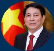
Chủ tịch nước Lương Cường