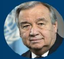
Tổng thư ký Liên hợp quốc Antonio Guterres