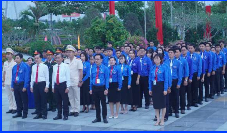
Đoàn đại biểu dự đại hội Đoàn TNCS Hồ Chí Minh tỉnh Vĩnh Long viếng nghĩa trang liệt sĩ tỉnh

Tài liệu SINH HOẠT CHI ĐOÀN LƯU HÀNH NỘI BỘ