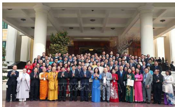
Tổng Bí thư Tô Lâm và đại biểu chụp ảnh chung với kiều bào tiêu biểu tham dự chương trình “Xuân quê hương” năm 2025.

Từ những thành bại trong lịch sử, có thể rút ra chân lý: Đoàn kết là vấn đề sống còn, quyết định thành bại của cách mạng. Nhờ đoàn kết, chúng ta biến nguy thành an, hóa giải được mọi âm mưu “chia rẽ, phá hoại” của kẻ thù. Ngược lại, mất đoàn kết dù chỉ cục bộ cũng làm suy yếu sức mạnh, thậm chí tiêu tan thành quả cách mạng. Vì vậy, xây dựng và giữ gìn đoàn kết luôn phải là mối quan tâm hàng đầu của mọi tổ chức cách mạng chân chính.